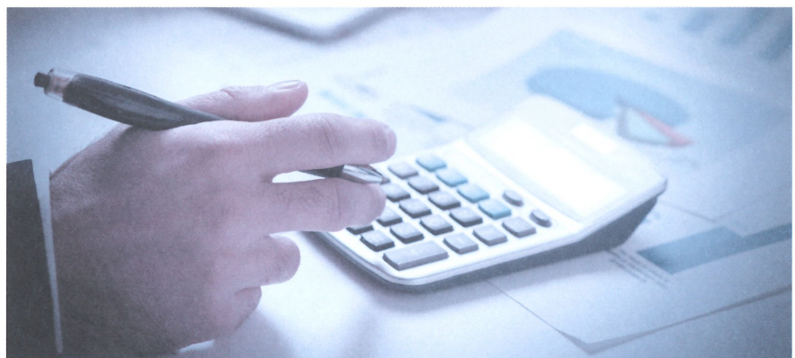
Liquiditätsplanung ermöglicht Flexibilität – und Kontrolle.

Für kleine Unternehmen reicht oft eine Excel-Tabelle, um die Liquidität für die nächsten drei oder sechs Monate zu planen. Selbst wenn Sie bei der erstmaligen Erstellung die Unterstützung einer Fachperson in Anspruch nehmen müssen, ist die Handhabung für jeden machbar. Neben den Ein- und Auszahlungen aus dem laufenden Geschäft sollte die Liquiditätsplanung auch die Kosten für Investitionen, Kapitalrückzahlungen und Steuern berücksichtigen. Kommen höhere Beträge zum gleichen Zeitpunkt zusammen oder unterliegt ein Betrieb saisonalen Schwankungen hinsichtlich der Einnahmen, kann dies schnell zu finanziel-